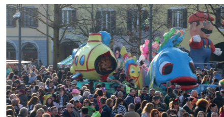
La piazza Maggiore gremita di gente a Carnevale.

stand del Comitato Regionale UNPLI Lombardia APS, per promuovere le nostre iniziative, la lingua locale ed i prodotti tipici. Una due giorni più che costruttiva per la nostra Pro Loco, che ha permesso di valorizzare il nostro territorio presentando anche il prezioso libretto "Inzago da scoprire".