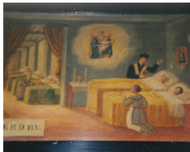
Un ex voto del Santuario della B. V. del Pilastrello, forse raffigurante le camere di degenza dell'Ospedale Marchesi.

allora che non potendo più reggere a caso si strano e per me tanto nuovo, con quella maggior forza di spirito per me possibile, proruppi: "Marchesi, datevi pace! Ricordatevi, perché è di fede, che Dio non abbandona mai chi di cuore in lui confida. Tutta la vostra speranza sia riposta nella sua bontà infinita e nei meriti del nostro buon Gesù crocifisso per noi e vivete per certo che a voi verrà conforto e sollievo". Preferite queste parole vidi, non molto dopo, spuntar sereno il di lui volto, e, a poco a poco, rinvigorire lo spirito. Egli si ricompose nella persona...". Nella tranquilla realtà del borgo di Inzagò, Marchesi amministrò il proprio patrimonio terriero ed immobiliare, partecipò alla vita amministrativa della Comunità, come membro della Deputazione comunale e si interessò, tra le altre cose, alla ricostruzione della chiesa Parrocchiale. Luigi Marchesi, l'artista osannato che aveva ricevuto applausi ed onori nei più famosi teatri italiani ed europei, figlio dello splendore artistico-musicale che l'Italia aveva donato al Mondo per tutto il '700, ritiratosi ad Inzagò dovette ben comprendere la realtà economica e sociale del borgo del tempo, perlopiù legata all'agricoltura ed a qualche attività artigianale.