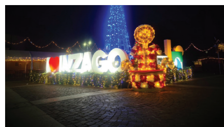
Un'immagine notturna de "L'albero dei riflessi" progettato e realizzato dai volontari Proloco.

Tanta gente, tanta gioia e grandissima partecipazione. Gli eventi invernali della Proloco sono, come ogni anno, forieri di grande successo di pubblico e critica. Le numerose proposte hanno trovato un genuino riscontro, cominciando da domenica 23 novembre con il giorno dedicato agli agricoltori, ossia la "Festa del ringraziamento". Questa giornata è una delle più antiche festività per chi lavora la terra e in essa si benedicono gli strumenti del lavoro per buon augurio in vista della semina e del raccolto, celebrando un nuovo ciclo agricolo. E mentre la terra riposa, s'accende il periodo natalizio.