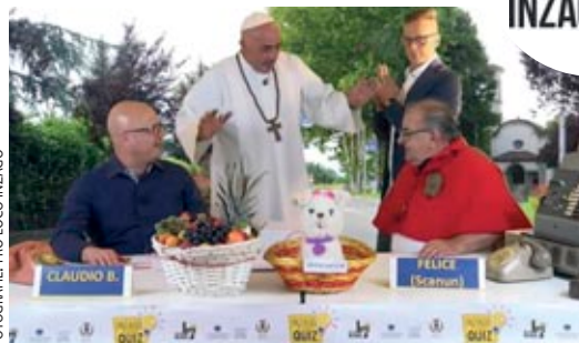
Immagine dell'Inzagò Live quiz