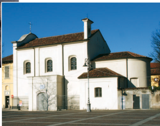
FOTOGRAFIE TRATTE DALLA GUIDA INZAGO IN TASCA