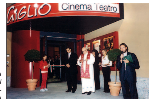
A destra: cerimonia di inaugurazione del Nuovo Giglio Cinema Teatro - Sala della Comunità