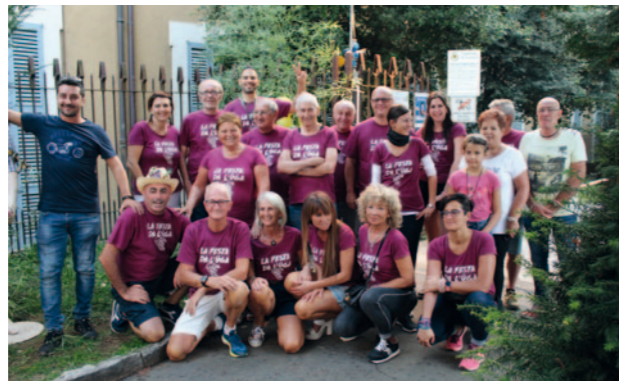
PRO LOCO INZAGO