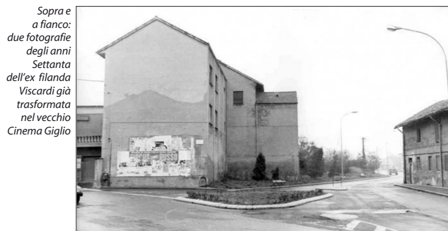
Sopra e a fianco: due fotografie degli anni Settanta dell'ex filanda Viscardi già trasformata nel vecchio Cinema Giglio