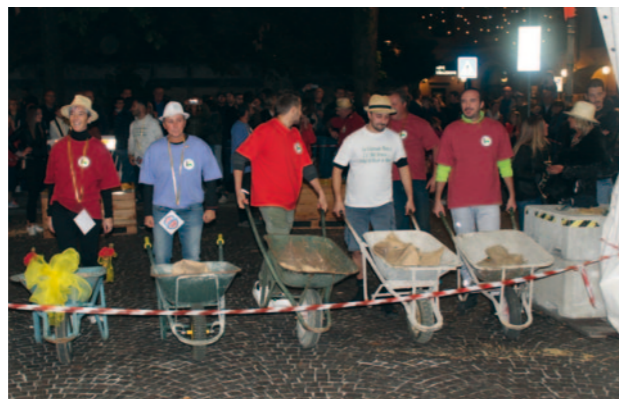
PRO LOCO INZAGO

vuto fare i conti con alcune difficoltà, ma la collaborazione delle diverse realtà inzaghesi, dell'Amministrazione Comunale, dei commercianti, delle aziende sponsor, dei soci tesserati, ma soprattutto di tutti gli inzaghesi che ci hanno sostenuto, ci ha portato sin qui.