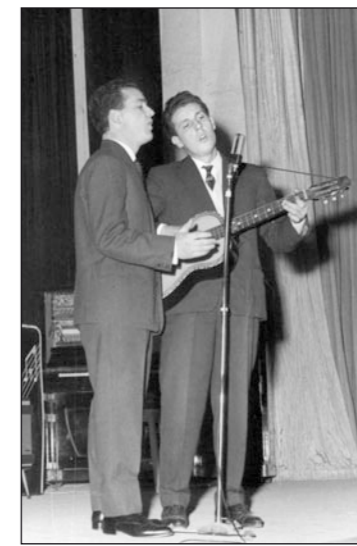
Sopra: il Microfono d'oro

Seguì un lungo periodo di chiusura, fino al recupero e al rilancio della Sala, avvenuto nel 2003, come: "Nuovo Giglio - Sala della Comunità".