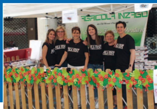
PRO LOCO INZAGO

Seguirà dal 23 al 28 giugno l'effervescente sei giorni del Vintage Roots Festival che vestirà il nostro paesello di un lustro d'oltreoceano riportandoci nei favolosi anni '50.